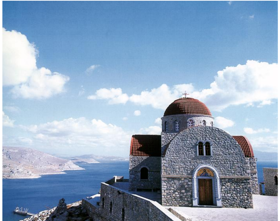
Ιερός Ναός Αγ. Σάββα του εν Καλύμνω Ασκήσαντος – Ακτιστον Φως

Municipal Tourist Organisation – Tel/Fax: 22430 59056