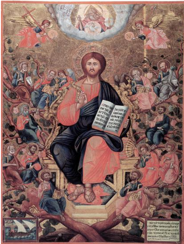
Από το τέμπλο του Ι.Ναού Κεχαριτωμένης Χώρας Καλύμνου – Ακτιστον Φως