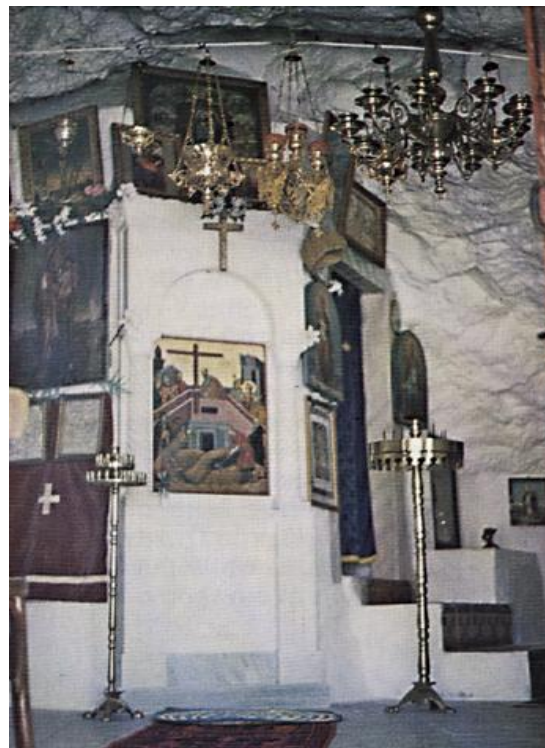
Μονή Σταυρού – εσωτερικό του παρεκκλησίου