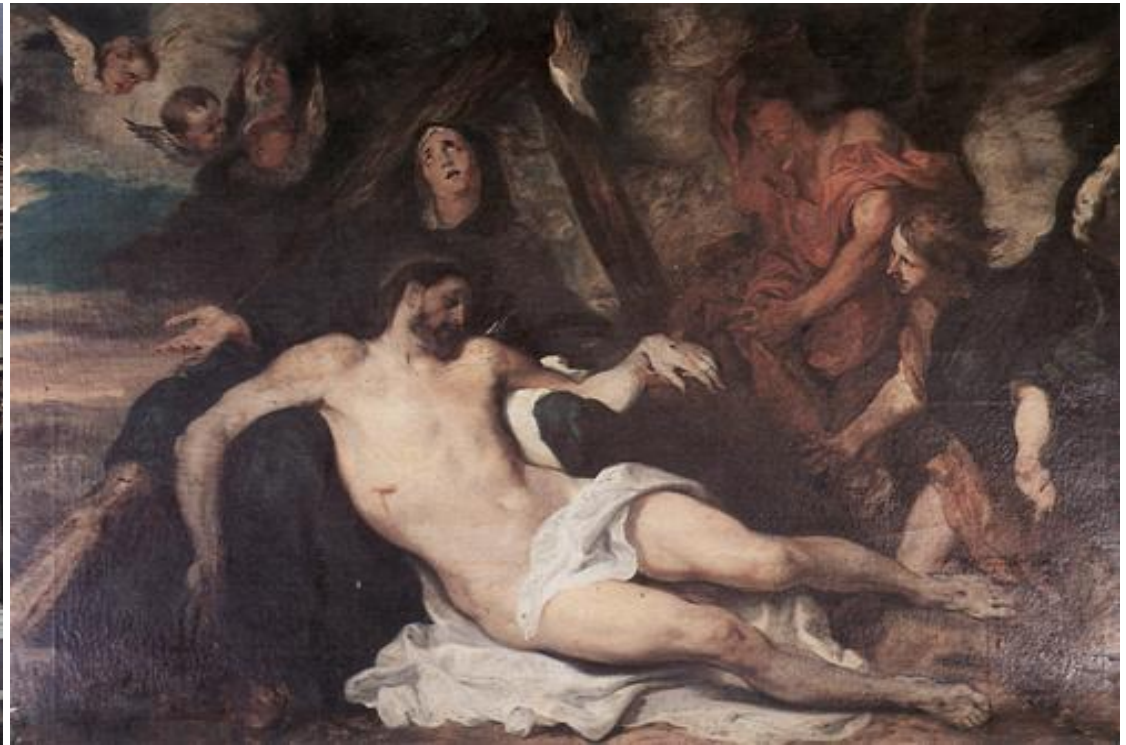
Γεώργιος Οικονόμου «Η Αποκαθήλωση», Μητροπολιτικός Ναός Σωτήρος Χριστού

Μαρμάρινο Τέμπλο δια χειρός πατρός Γιαννούλη Χαλεπά – Ακτιστον Φως