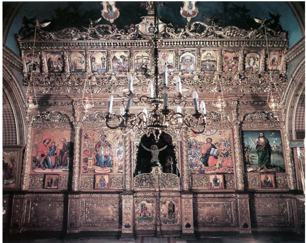
Επίχρσο ξυλόγλυπτο τέμπλο Ι.Ναού Κεχαριτωμένης Χώρας Καλύμνου 1805 μ.Χ.