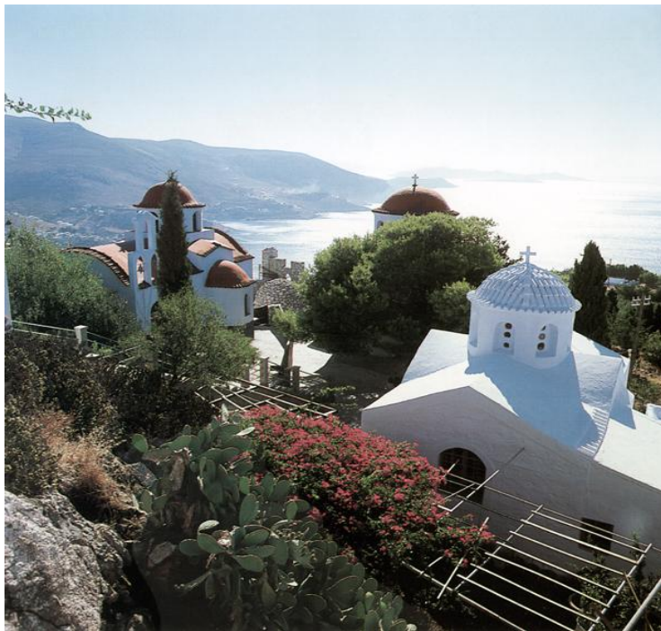
Από την Ι.Μονή των Αγίων Πάντων Καλύμνου – Ακτιστον Φως