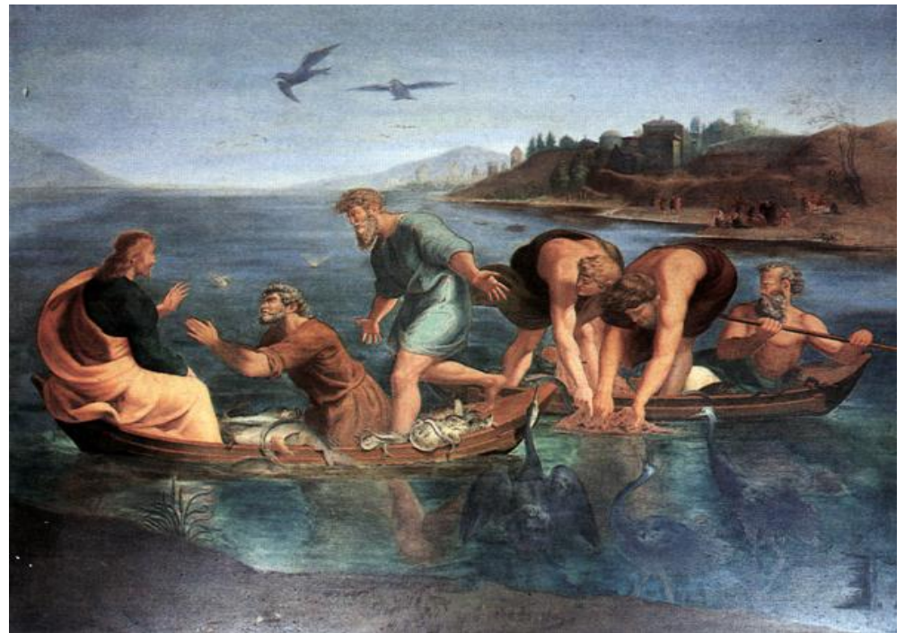
Μιχαήλ Αλαχούζος «Οι αλιείς στην Τιβεριάδα», Αγ.Νικόλαος Πόθιας