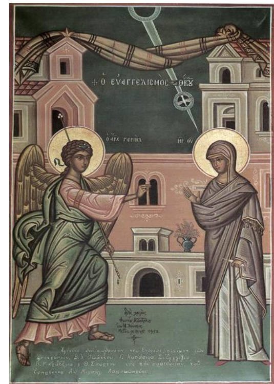
«Ευαγγελισμός της Θεοτόκου», εικόνα του Φώτη Κόντογλου – Ι.Ναός Ευαγγελιστρίας Καλύμνου – Ακτιστον Φως