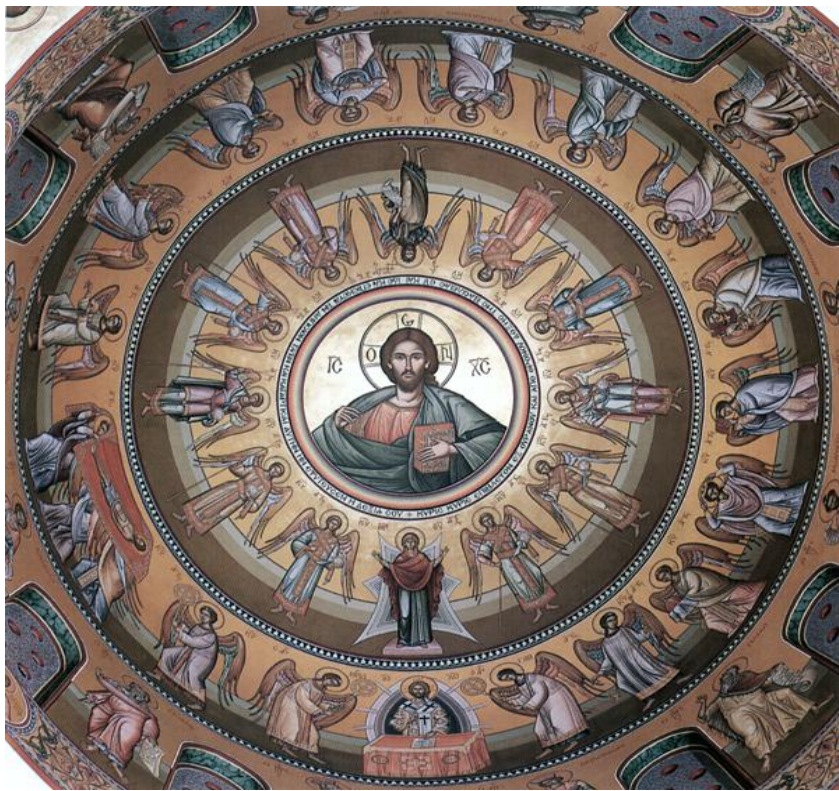
Ο Παντοκράτωρ του προύλλου του Ι.Ναού του Αγ.Σάββα, έργο του Χ.Γιατρά - Ακτιστον Φως